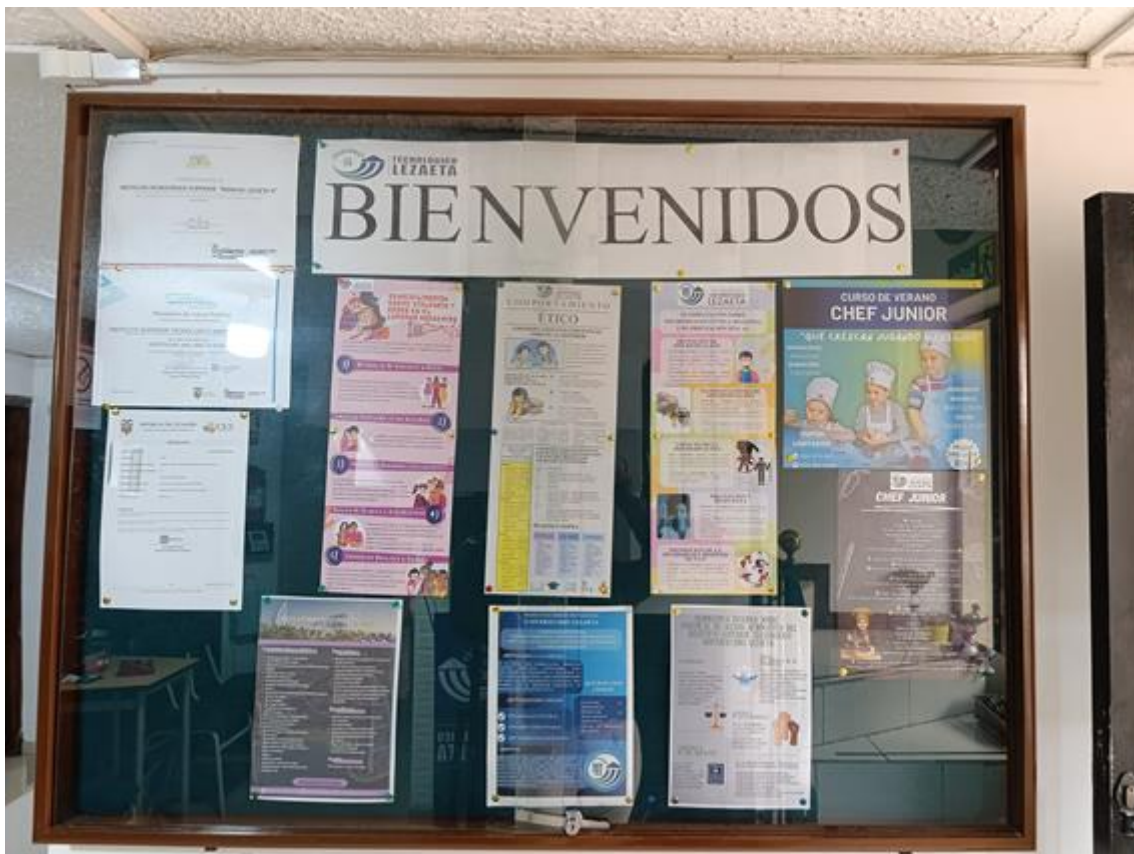
Difusión en Cartelera del ISTUML.